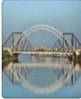
جَسْرٌ عَلَى نَهْرِ السِّنْدِ